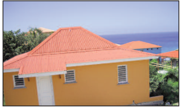
Commune de TRINITE